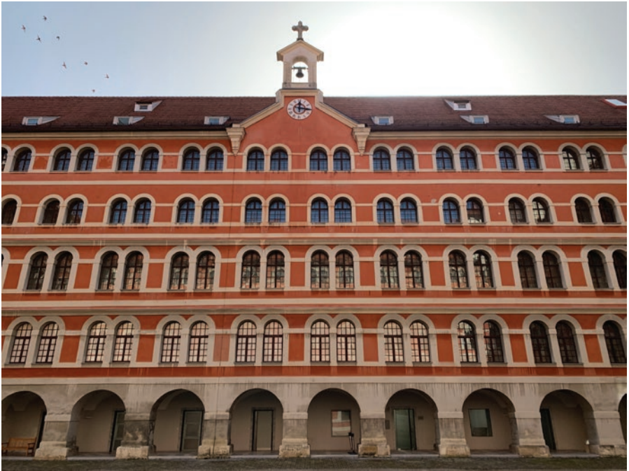
Former Jesuit college (today seminary, diocesan archives, diocesan museum), built from 1572, enlarged in 1591-1597, extended by one floor in 1714-1718, in Graz, Styria