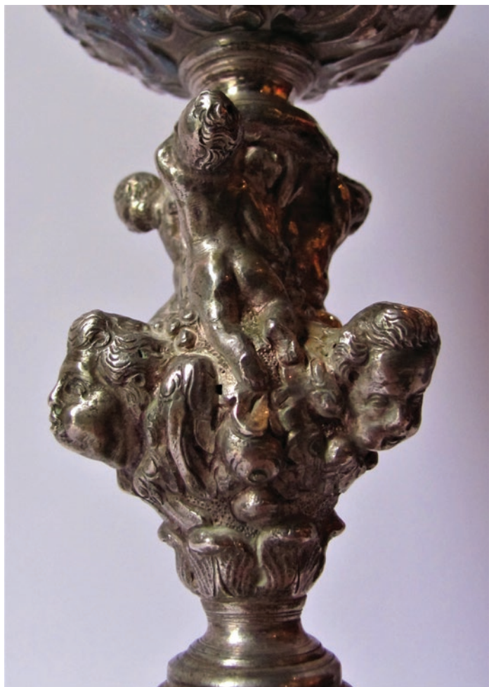
Nepoznata venecijanska zlatarska radionica, Kalež (detalj), 1. polovica 18. stoljeća, Osor