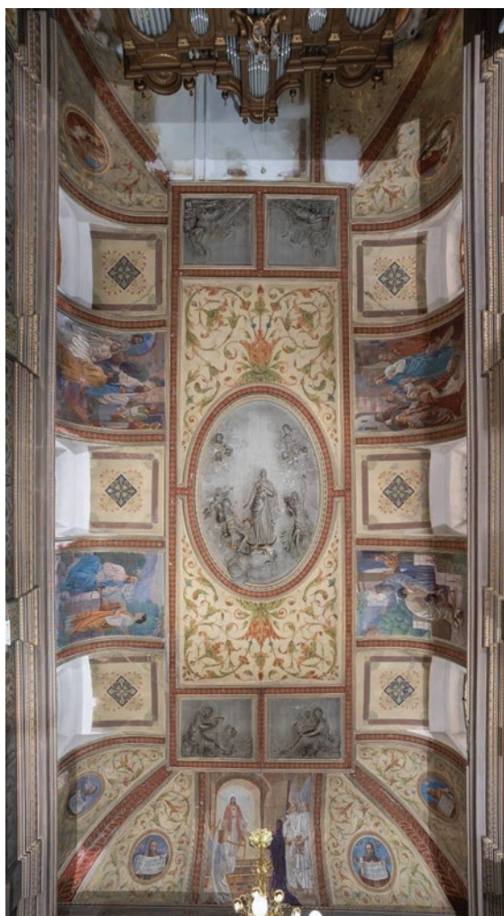
Svod crkve sv. Filipa i Jakova