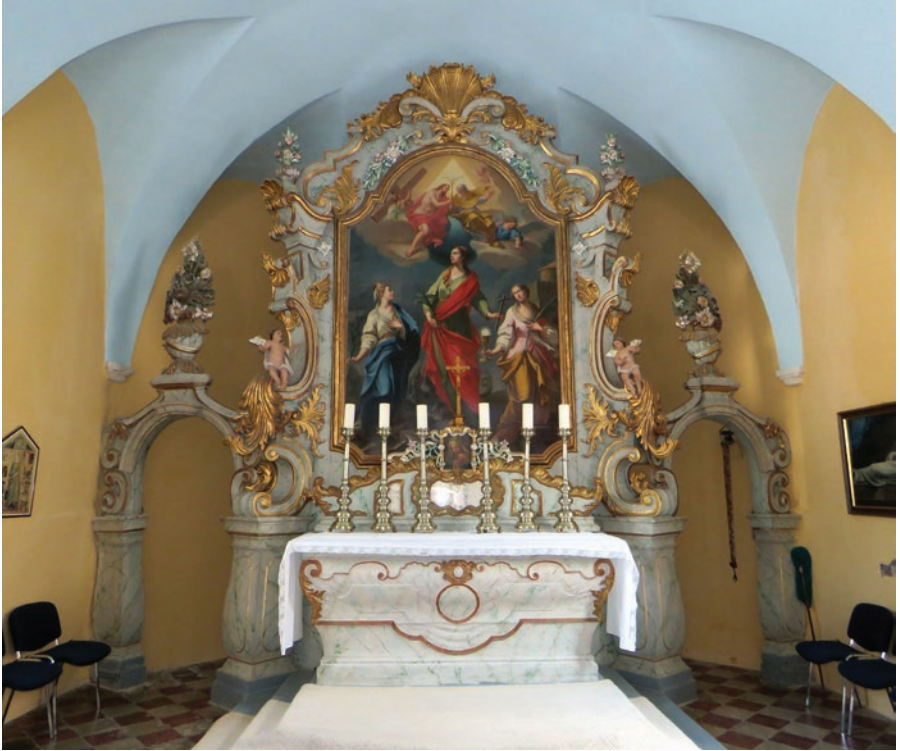
Glavni oltar u crkvi sv. Margarete, 1758., Bakar