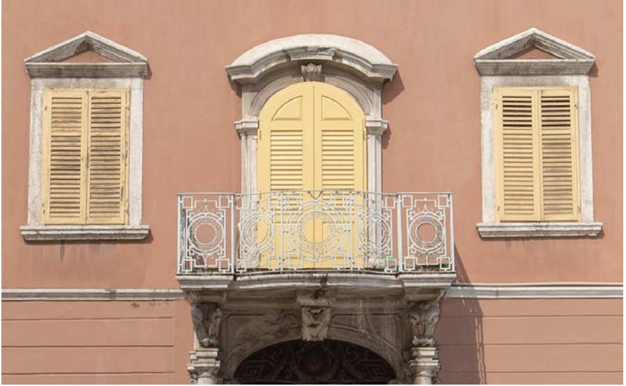
Palaca Vuković, detalj pročelja, Rijeka