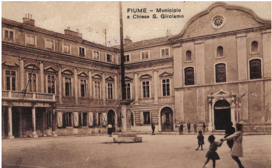
FIUME – Municipio e Chiesa S. Girolamo