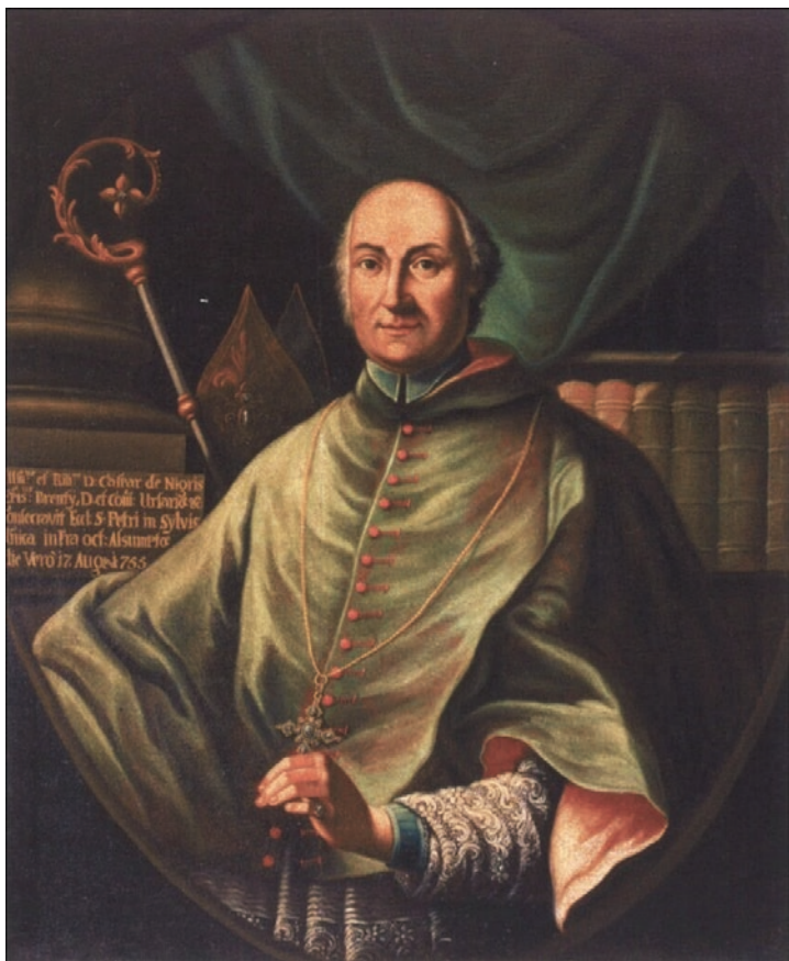
Leopold Kecheisen, Portret biskupa Gaspara Negrija, 1755., Zbirka crkvene umjetnosti u Biskupiji Eufrazijane, Poreč