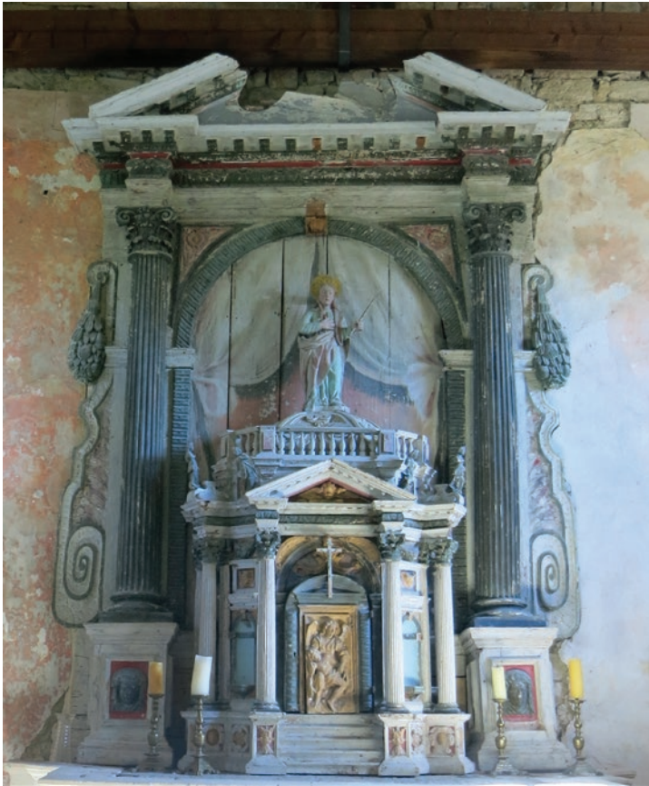
Drveni oltar, crkva sv. Marije Magdalene, Škopljak, Istra