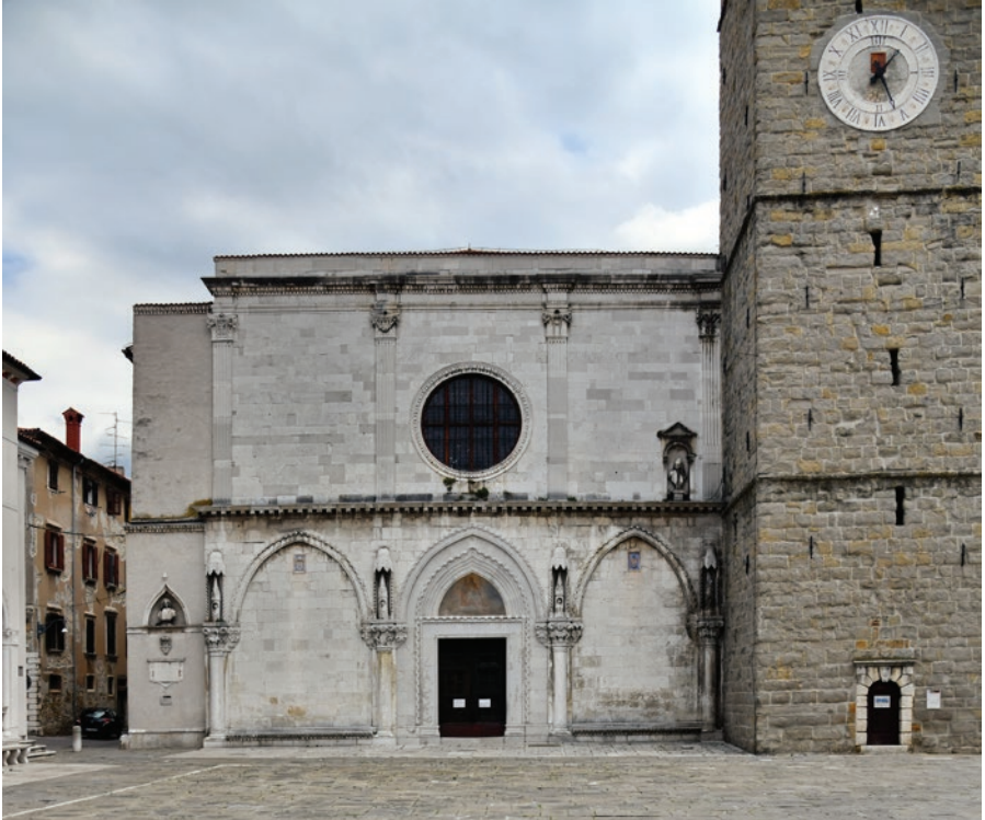
Fasada koperske stolnice