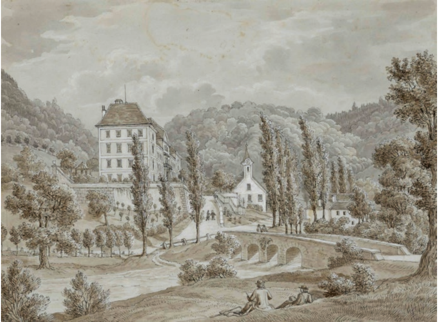
Franz Kurz zum Thurn und Goldenstein, Pogled na grad Haasberg (danes danes v ruševinah)