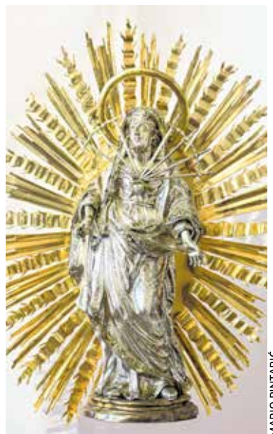
Kip Bogorodice od Sedam Žalosti, 1731., u galeriji katedrale svetog Vida, iz radionice augsburškog zlatara Johanna Davida Salera, Rijeka

- Uz bratovštinu se veže i naruđba jednog od najznačajnijih zlatarskih djela na području nekadašnje Pulske biskupije kojoj je sve do kraja 18. stoljeća pripadala i Rijeka, a to je srebrni kip Bogorodice od Sedam Žalosti. Novopronađeni arhivski dokumenti sada otkrivaju kako su pripadnici bratovštine 1730. prikupili novčana sredstva da bi zatim iste godine u cijenjenoj augsburškoj zlatarskoj radionici obitelji Saler bio naručen srebrni kip koji je dopremljen u Rijeku 1731. godine, kaže Pintarić.