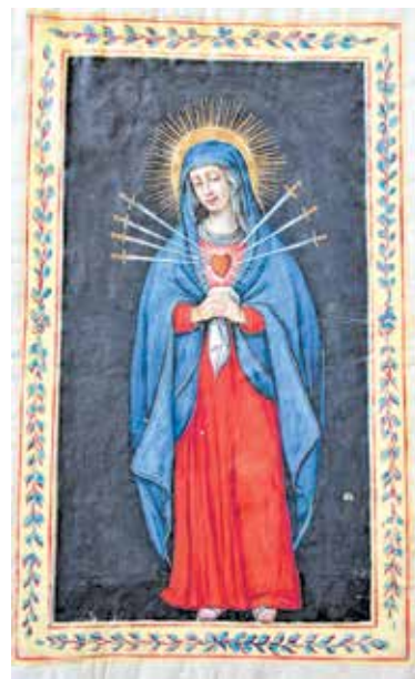
Nepoznati autor, Prva stranica knjige Bratovštine Gospe Žalosne, 1778., Arhiv katedrale svetog Vida, Rijeka

tadašnji razvoj umjetnosti i kulture su stvoreni.