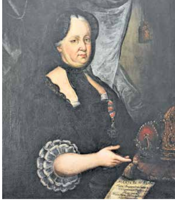
Nepoznati autor, Carica Marija Terezija, 1778., izvorno se nalazila u riječkom benediktinskom samostanu, a danas u samostanu San Daniele, Abano Terme