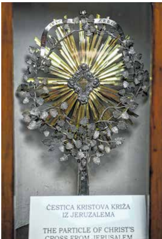
Relikvijar s česticom Kristova križa iz Jeruzalema