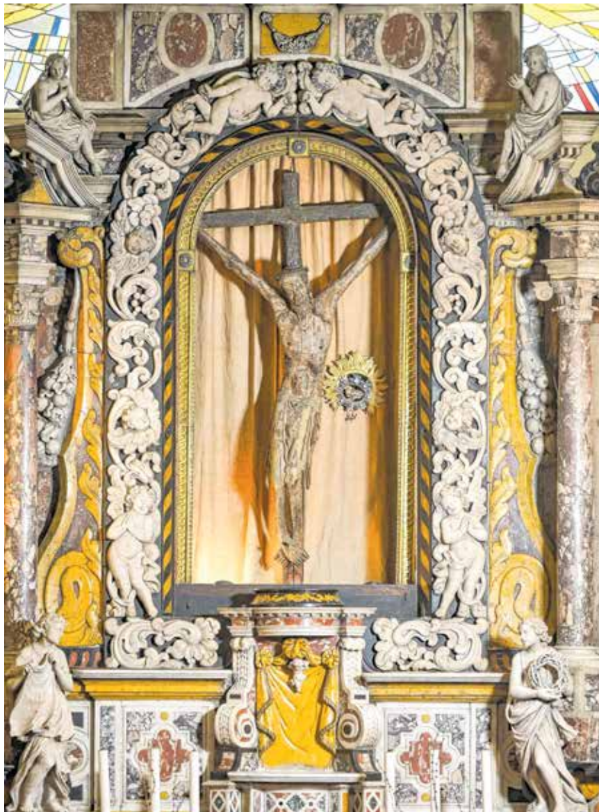
Čudotvorno raspelo Riječani časte i danas

Sveti Vid pod svojim svodovima čuva drevnu, i često puta to zaboravljamo, slojevitu povijest grada. Svetac, zaštitnik grada i Čudotvorno raspelo povezuju vjernika i posjetitelja sa srednjim vijekom, dok centralni tlocrt s polustupovima ocrtava razdoblje kasne renesanse, koje će tek s bogatom mramornom opremom oltara s kipovima potvrditi raskošno razdoblje baroka. Monumentalna kružna masa katedrale i silueta široke kupole s lanternom postala je prepoznatljiv i nezamjenjiv naglasak u urbanom tkivu grada koji svjedoči o minulom zlatnom dobu Rijeke, kaže prof. Damir Tulić