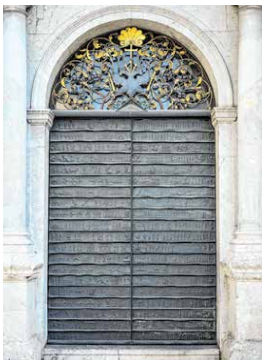
Monumentalan glavni ulaz u katedralu – dvokrilna brončana vrata s prikazima opće i hrvatske crkvene povijesti, kipara Ljube de Karine iz 1999.