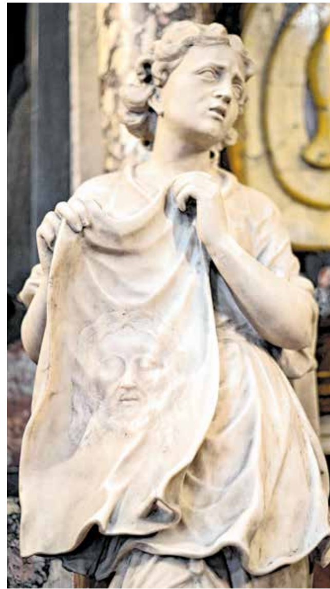
Mramorni andeo s Veronikinim rupcem, detalj na glavnome oltaru katedrale