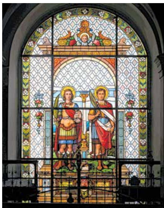
Vitraj – sv. Vid i sv. Modesto