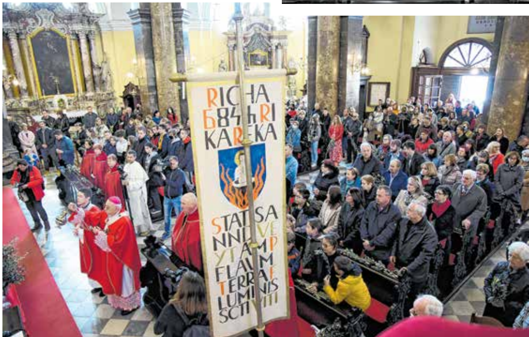
Cvjetnica u riječkoj katedrali