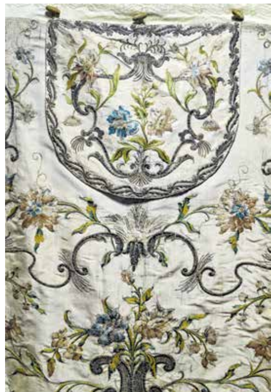
Misno ruho u sakralnoj zbirci katedrale