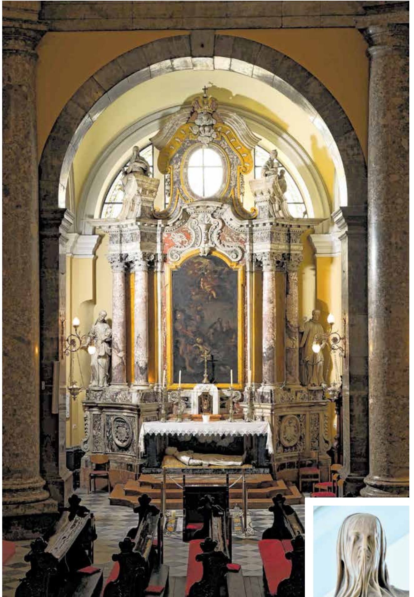
Mramorni oltar sv. Franje Ksaverskog, Michelazzijevo remek-djelo, 1736.

U crkvi svetog Vida djelovala je i Bratovština Gospe Žalosne, osnovana 1631. godine, a zanimljivo je da su se u tu bratovštinu primali i članovi plemstva, obrtnici