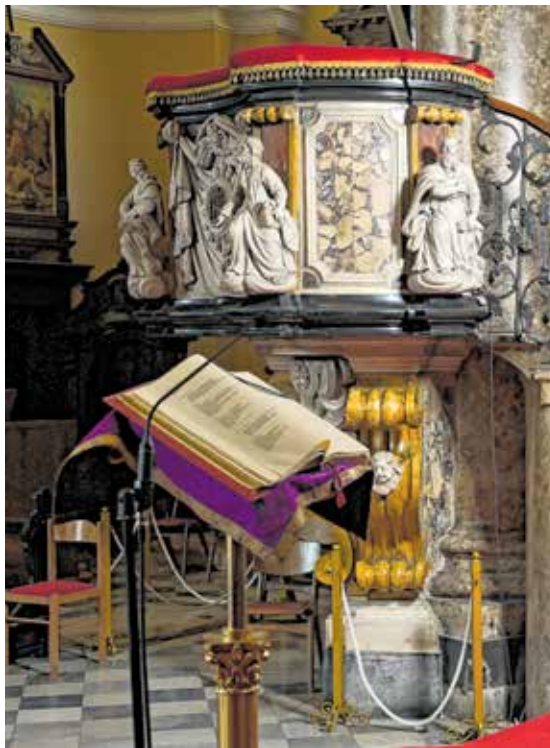
Propovjedaonicu s likovima evanđelista i Kristovim monogramom 1731. izradio je Antonio Michelazzi