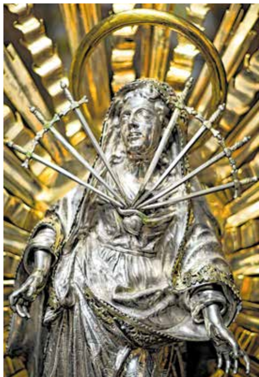
Gospa Žalosna - nastala 1731. u radionici Johanna Davida Salera u Augsburgu

S lijeve strane glavnih ulaznih vrata uzidana je željezna topovska kugla s natpisom na latinskom: Ista dabat Gallos pulsvra hinc Anglia poma, ili što će reći: Ovo voće poslala je Engleska kada je odavde htjela istjerati Francuze. Podsjetnik je to na 1813. godinu, kada su Englezi pucali iz brodova na grad suprotstavljajući se Napoleonovoj vojsci koja je zauzela Rijeku.