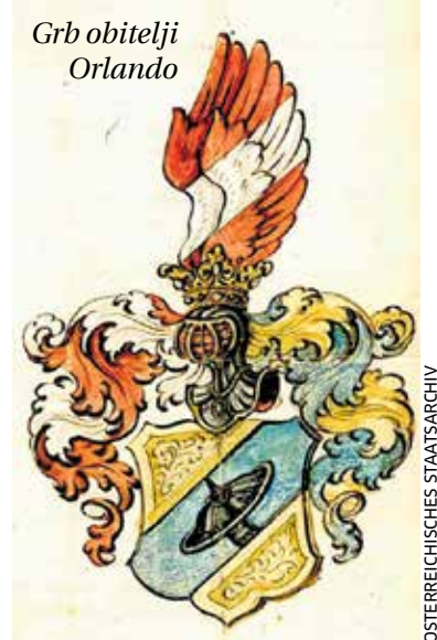
Grb obitelji Orlando