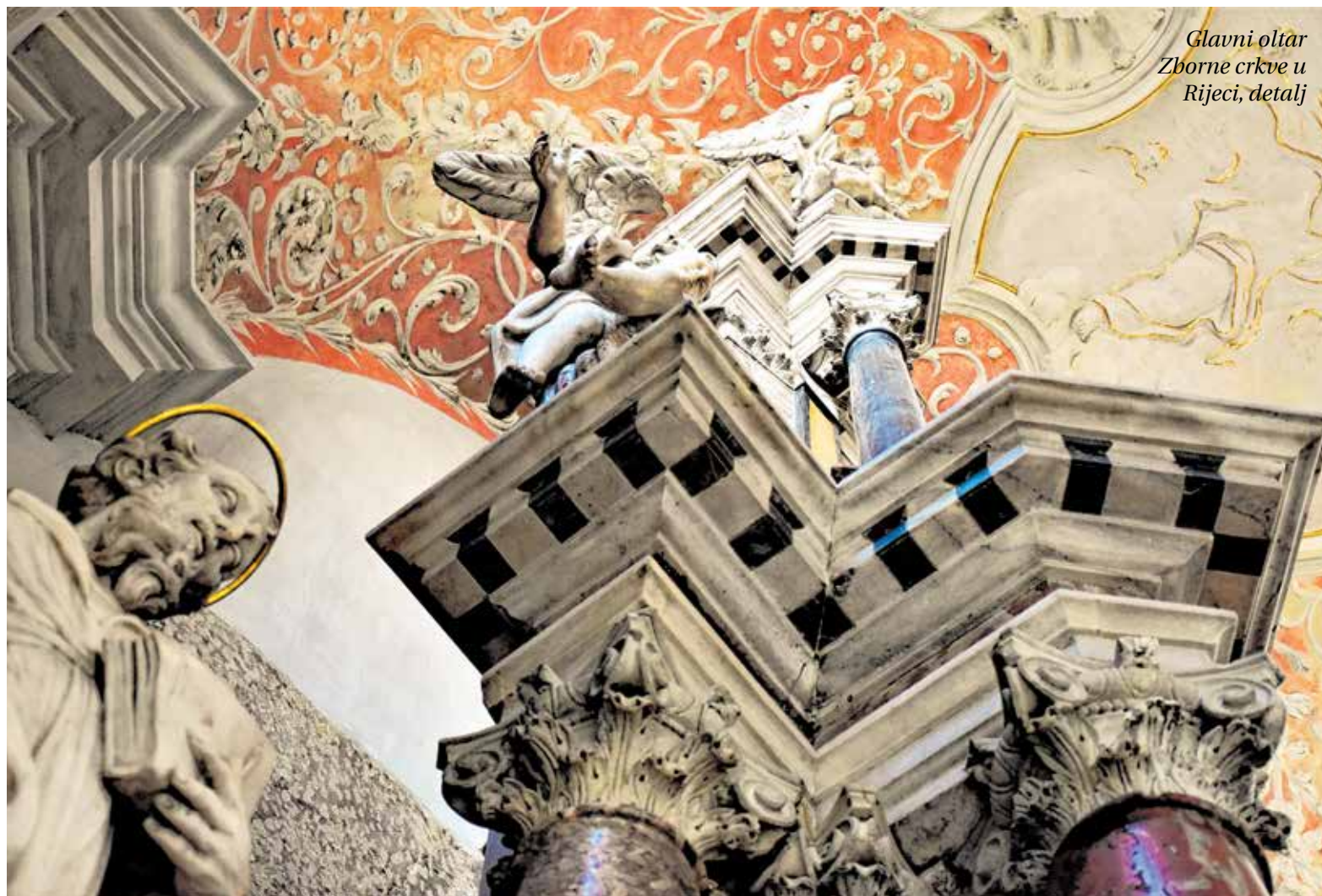
Glavni oltar Zborne crkve u Rijeci, detalj